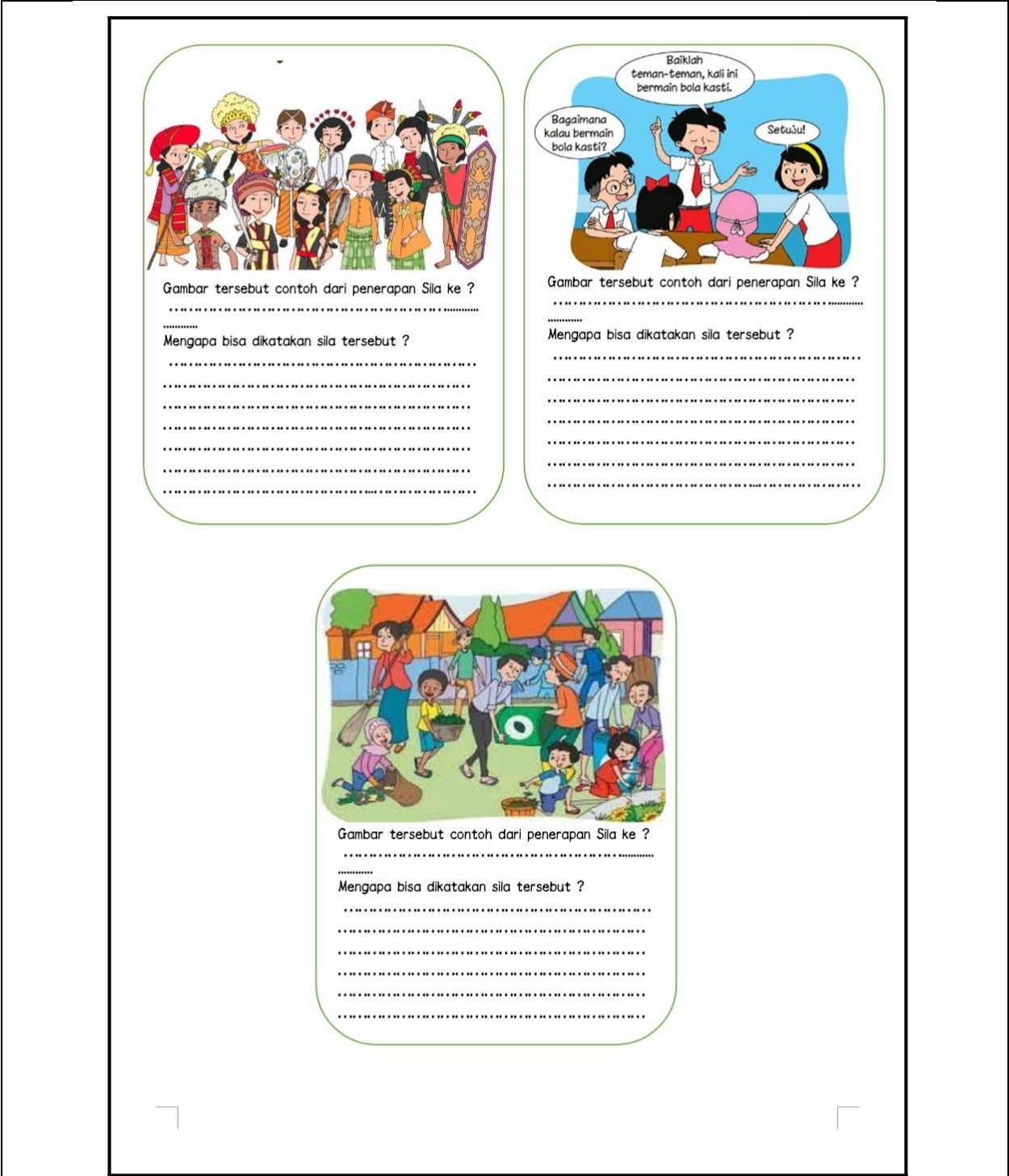
Gambar 4. Keberagaman Budaya yang ada di Indonesia Gambar 5. Bermusyawarah dengan teman Gambar 6. Masyarakat yang sedang bergotong-royong membersihkan lingkungan